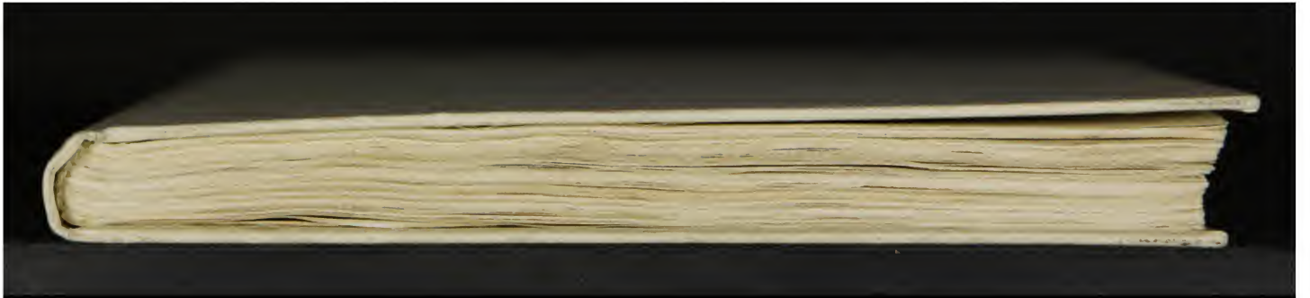
Early European Books, Copyright © 2011 ProQuest LLC. Images reproduced by courtesy of the Biblioteca Nazionale Centrale di Firenze. CFMAGL. 1.6.516/a